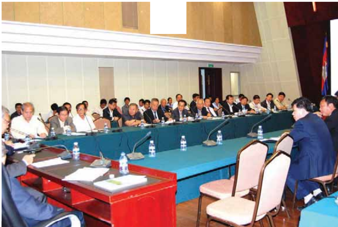
រូបភាពក្នុងបទបង្ហាញស្តីពី ជំនួយខ្យល់ និងការរៀបចំគម្រោងវិនិយោគ